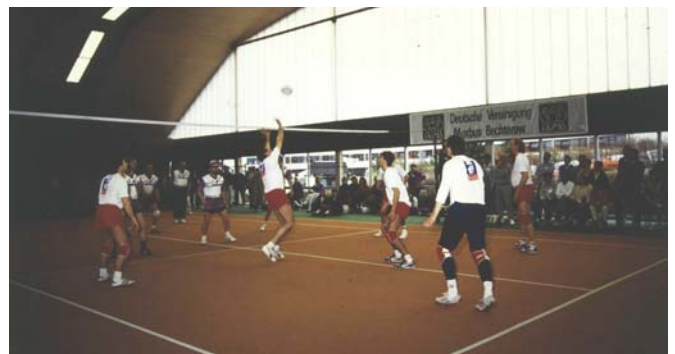
Bundesweites Volleyball-Turnier beim 10-jährigen Jubiläum der DVMB in Willingen (Sauerland)

Vom 6. bis 8. April fand in Willingen (Sauerland) das 10-jährige Jubiläum der DVMB statt. Ärztliche Vorträge, Workshops und ein bundesweites Volleyballturnier wurden von über 850 Teilnehmern besucht. Höhepunkt war die „Karibische Nacht“ ( Bechterew-Brief Nr. 41 S. 36–50 ).