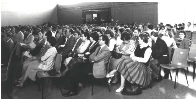
Teilnehmer der 2. DVMB-Mitgliederversammlung in Darmstadt-Wixhausen