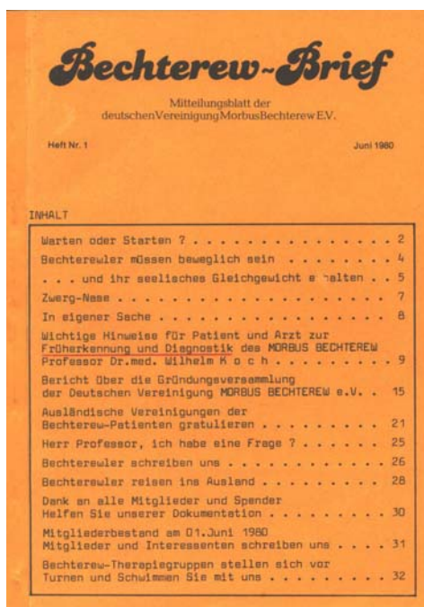
Titelseite der Nr. 1 des DVMB-Mitteilungsblatts