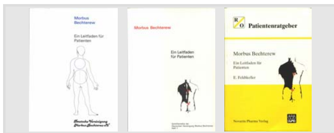
Der „Leitfaden für Patienten“ der DVMB: 1. Auflage 1985 (links), 2. Auflage 1992 (Mitte), erste im Novartis Pharma Verlag erschienene Auflage 1997 (rechts). Weitere überarbeitete Auflagen erschienen 1998, 1999, 2000 und 2002.

Zusammen mit dem Bechterew-Brief Nr. 21 wird allen Mitgliedern die 1. Auflage des Leitfadens für Patienten übersandt. Vorbild war der Leitfaden der britischen National Ankylosing Spondylitis Society (NASS). Als Anhang wurde das Morbus-Bechterew-Gymnastik-Grundprogramm der Gesellschaft medizinischer Assistenzberufe für Rheumatologie e.V. (GmAR) abgedruckt. Die Herstellungskosten übernahmen die Firmen Heinrich Mack Nachfolger in Illertissen und Pfizer GmbH in Karlsruhe ( Bechterew-Brief Nr. 21 S. 34).