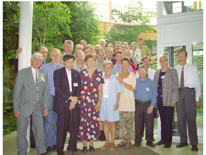
Delegierte aus Australien, Belgien, Dänemark, Deutschland, England, Irland, Japan, Kanada, Norwegen, Österreich, Portugal, Schweden, der Schweiz, Slowenien, Spanien, Tschechien und Ungarn trafen sich zur 5. ASIF-Delegiertenversammlung in Mettlach-Orscholz.

Die DVMB war Ausrichterin der 5. ASIF-Delegiertenversammlung, die vom 2. bis 5. September 1999 in der Reha-Klinik Saarschleife in Mettlach-Orscholz stattfand ( Bechterew-Brief Nr. 79 S. 29–32 ).