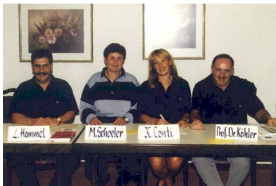
Die Referenten des Wochenendseminars „Morbus Bechterew – frisch diagnostiziert“

Am 12./13. August fand erstmals das Wochenendseminar „Morbus Bechterew – frisch diagnostiziert“ statt ( Bechterew-Brief Nr. 37 S. 46 ). Das Seminar wird seither mehrmals im Jahr durchgeführt, heute unter dem Namen „Morbus Bechterew – Basiswissen“.