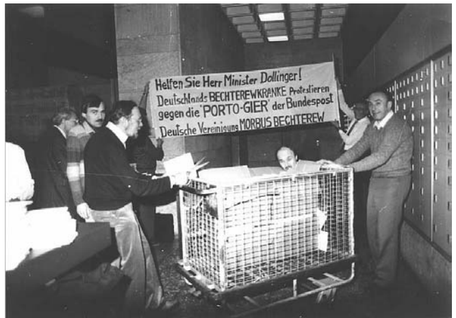
Protest gegen die unsinnige bürokratische Behinderung der Arbeit der DVMB durch die Oberpostdirektion Nürnberg

Viel später entschuldigte sich das Bundespostministerium